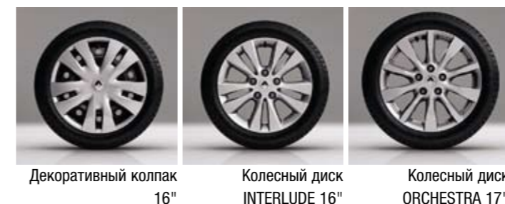
Декоративный колпак 16"