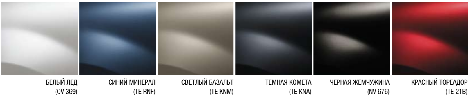
БЕЛЫЙ ЛЕД (OV 369)